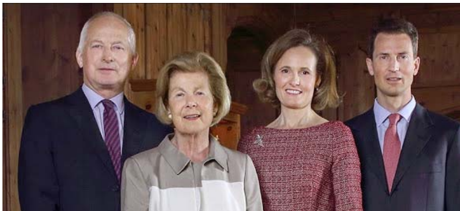
Княжеская Семья Лихтенштейна -- князь Ханс-Адам II, княгиня Мария, наследный князь Алоиз и наследная княгиня София.

И ДА БЕЖАТ ОТ ЛИЦА ЕГО НЕНАВИДАЮЩИЕ ЕГО,