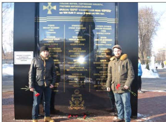
Вечная память русским героям!

Открытие стелы стало значимым событием в культурной жизни г. Тулы и привлекло к себе внимание широкой общественности.