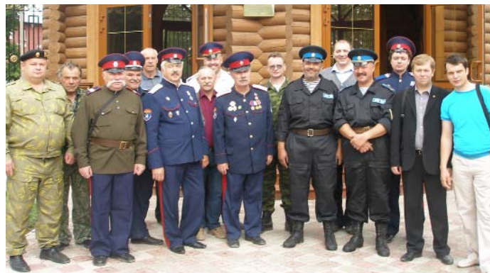
РИС-О и Тульской городской казачьей общины. На мероприятии присутствовали соратники РИС-О, казаки, Тульское дворянское собрание

24 июня в 10.00 в храме Святого Равноапостольного Великого Князя Владимира прошла панихида по русским солдатам и офицерам, принявшим участие и погибшим в Отечественной войне 1812 года. Панихида была организована силами Тульского отдела