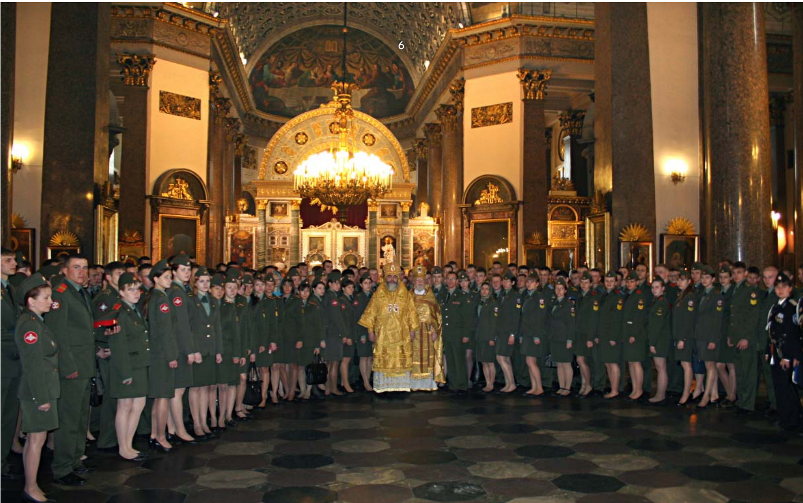
В Казанском кафедральном соборе Санкт-Петербурга

аспектам парусного дела и формирование патриотизма и гражданственности.