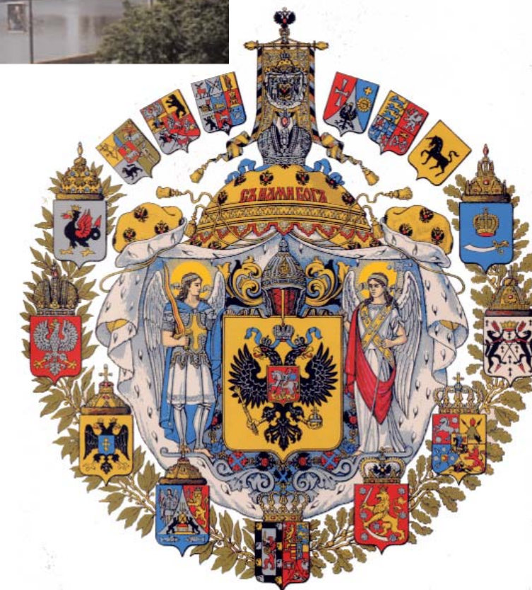
РИС-О считает необходимым всячески содействовать сохранению территориальной целостности и суверенитета Российской Империи.

Одной из проблем чрезвычайной важности, много раз уже сыгравшей значительную роль в судьбах нашей Родины, является русофобия, систематически распространяемая врагами России. Всемерная борьба с русофобией является прямою задачей РИС-О.