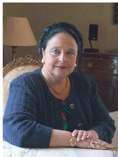
РИС-О считает необходимым всячески содействовать объединению всех российских монархистов вокруг законной Государыни и защиту Ее Особы и Российского Трона от любых возможных посягательств.

В настоящее время Главою Российского Императорского Дома, согласно Закону о Престолонаследии 1797 г. и Учреждению об Императорской Фамилии 1886 г. является Ее Императорское Высочество Государыня Великая Княгиня МАРИЯ ВЛАДИМИРОВНА . Ее Наследником является Его Императорское Высочество Великий Князь ГЕОРГИЙ МИХАЙЛОВИЧ .